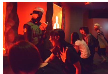
▲以前開催した「忍戦ツアー」の様子