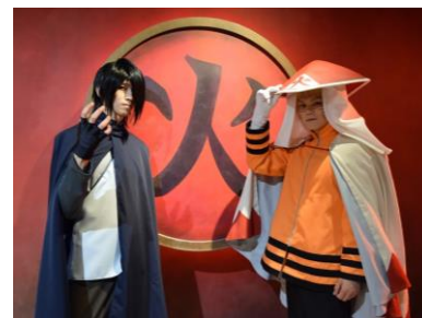
(右)うずまきナルト (左)うちはサスケ ※写真は2016年に実施した 「忍戦ツアー」のものです。

期間限定アトラクション「BORUTO-ボルト- 真夏の特別ミッション 呪われた廃墟へ潜入せよ!」を、うずまきナルト、うちはサスケと一緒に体験できます。