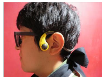
▲骨伝導の無線機 (ボルト達の声が聞こえます)