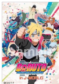
《参加賞》 ステッカー (全1種)