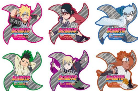
《成功賞》ランダムでお渡し 手裏剣型ステッカー (全6種)

【景品】 ※「木ノ葉隠れの里 手裏剣術の修業」、「うちは一族の火遁修業」共通の景品です。