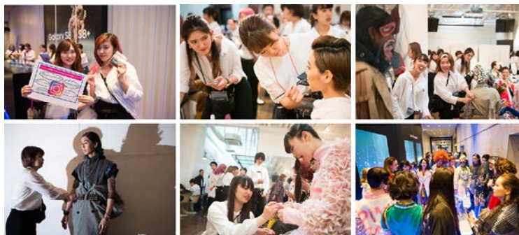
－ ショー前の学生やモデルの様子 －