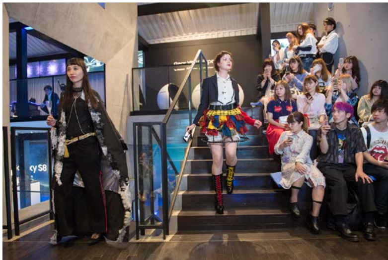
- バンタンデザイン研究所の学生によるファッションショー『わくわく SHOW』 -