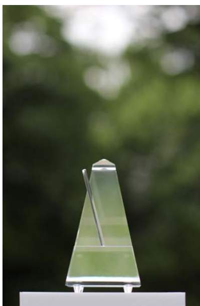
4. 《自然を測るメトロノーム》2017年