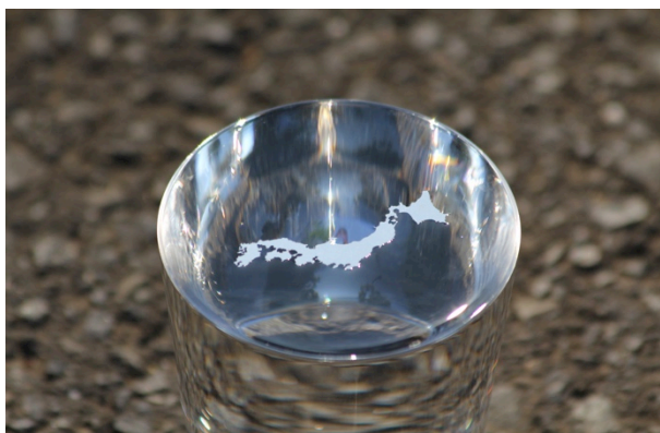
3. 《日本列島の方位磁針》2011年