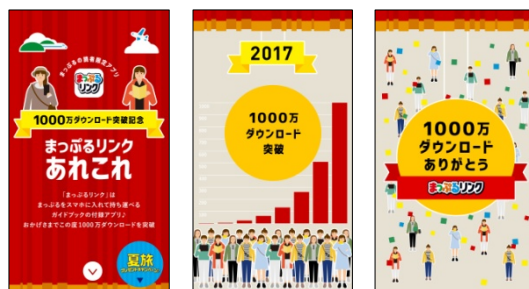
<特設ページ画面イメージ>

⇒ http://www.mapple.co.jp/thx/mapplelink_dl10m.html