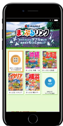
<「まっぷるリンク」TOP 画面>

この間広告等は一切出しておらず、店頭告知、自社媒体告知、口コミのみでの増加ということで、旅そのものに紙と電子書籍を組み合わせる使うスタイルが完全に定着してきたことがわかります。