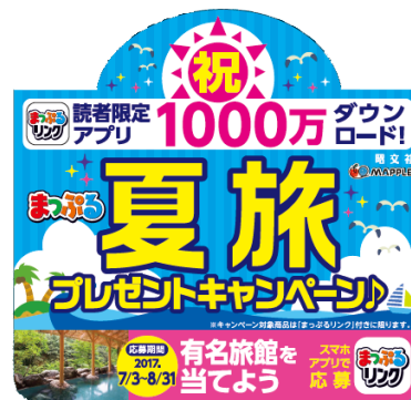
<キャンペーン用店頭 POP>

書店・コンビニエンスストア・オンラインショップにて「まっぷるリンク」付きの対象商品をお買い求めのお客様