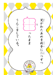
<うんこ例文カード 一例>

うんこ先生わたあめ ～今日は、うんこ型のわたあめを買いに ナンジャタウンへ行く予定だ。～ 価格：700円