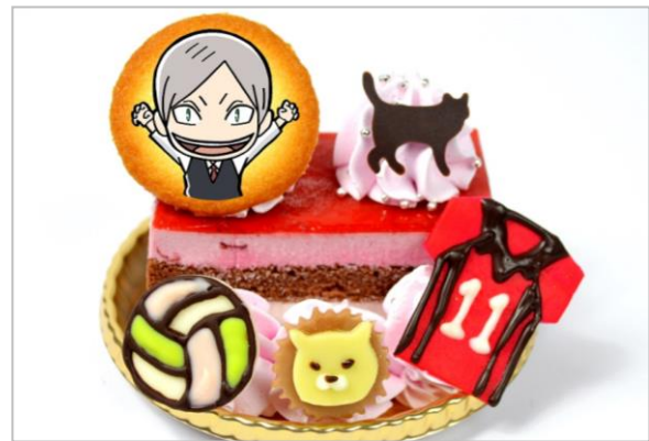
灰羽リエーフの“リエーフ見参!”ケーキ (サワーチェリーケーキ) (700円)

サワーチェリーケーキに、チョコで作った猫、獅子、ユニフォーム、バレーボールを飾りました。