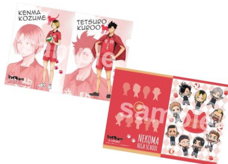
クリアファイル2枚セット (全1種/756円)