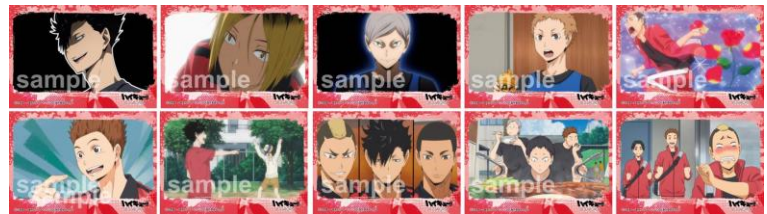
イラストシート (全10種)