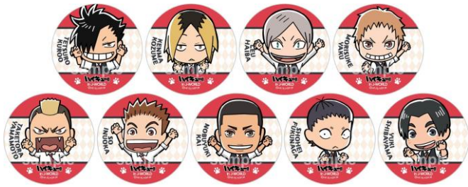
56mm 缶バッジ (全9種)