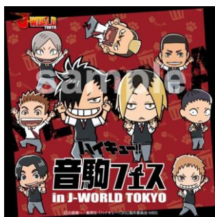
マイクロファイバータオル (全1種/648円)