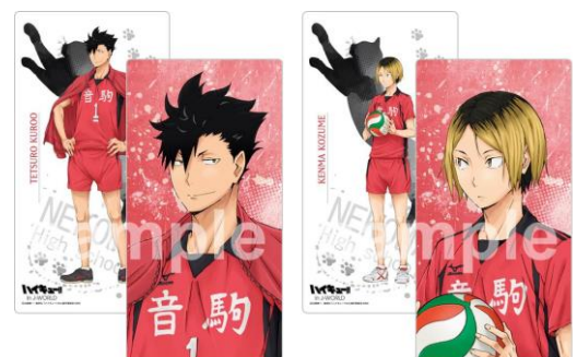
ロングクッション (全2種/各2,700円) ※店頭での受注販売