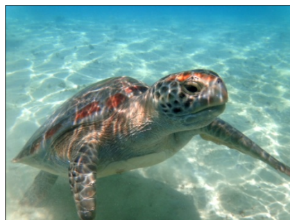
<左：サンドバー、右：ウミガメ（キャプテンブルース天国の海ツアーより）>