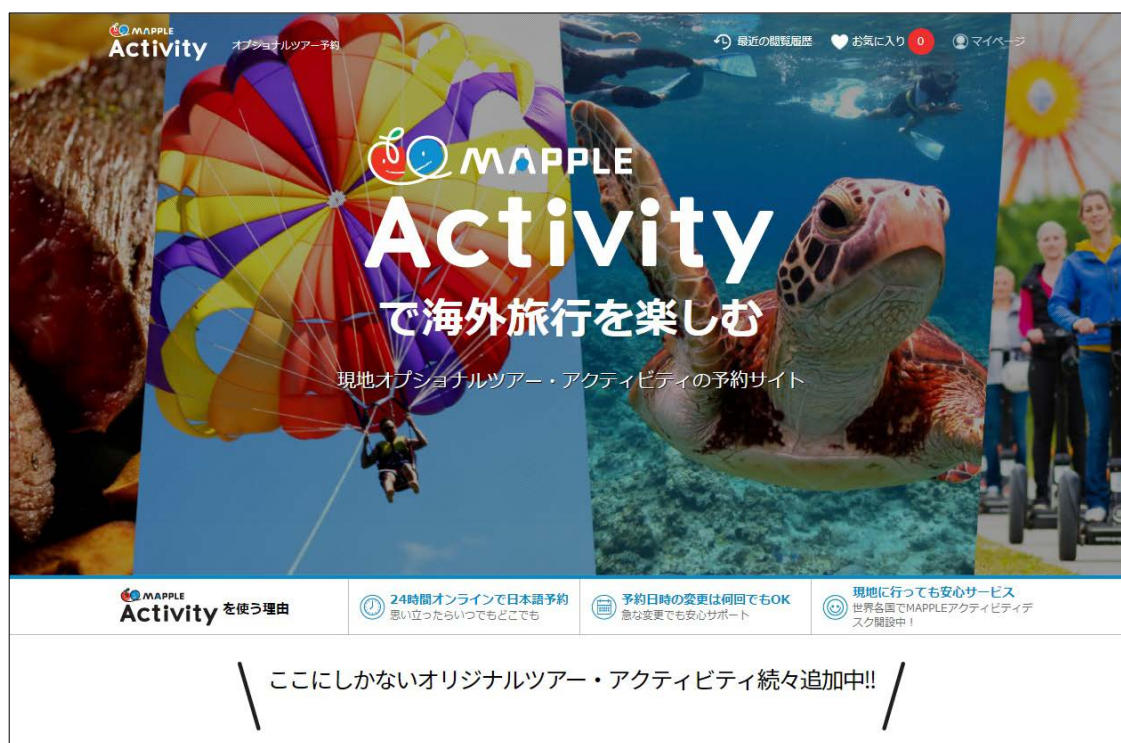
&lt;サービスサイト TOP 画面&gt;

株式会社昭文社（本社：千代田区麹町、代表取締役社長 黒田茂夫、東証コード：9475）は、新たな海外旅行向け現地オプションツアー予約・販売代行サービス「MAPPLE Activity（マップルアクティビティ）」をこの7月より開始しましたことをお知らせいたします。