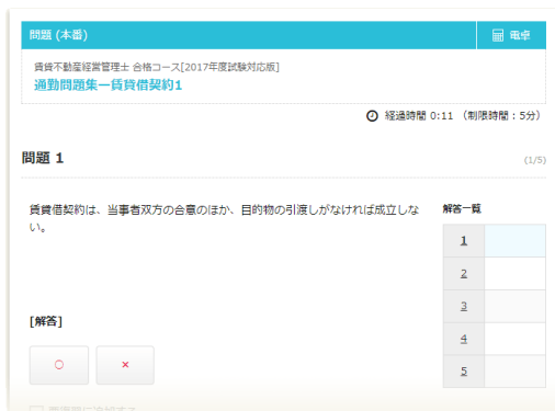
学習内容の定着に効果的な通勤問題集