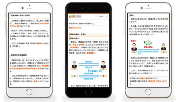
速習に便利なオリジナルWEBテキスト