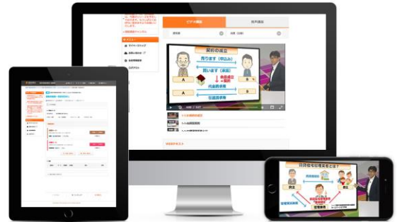
初学者でも分かりやすいビデオ&音声講座

基本的な知識や体系を「ビデオ・音声」や「WEBテキスト」で効率的にインプット学習し、アウトプット（問題演習）としてオリジナルの「通勤問題集」や「セレクト過去問集試験」を解くことで短期合格を実現する実力を身につけることができます。