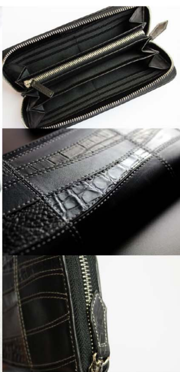
【EXECUTIVE】ラウンドジップウォレット/WAVE

クロコダイルレザーとラムレザーをデザイン的に組合せたラウンドファスナータイプの長財布。「波」をデザインテーマとし、本体を大きく横切るようにゆったりと波打つパッチワークパターンと、使用部位がランダムなクロコダイルレザーが描く革模様が特徴です。 ラムレザーはスペインラムと同等の良質な羊革を使用し、ツルツルとした質感と肉厚でふわふわした触感が味わえます。 素材同士の組み合わせで生み出す、それぞれが世界で一点物のデザインをお楽しみください。