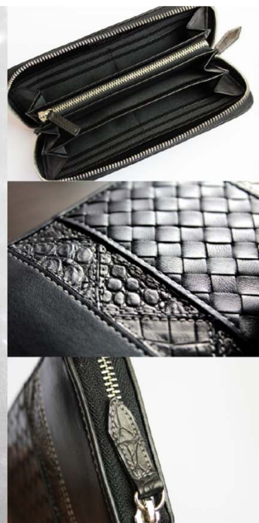
【EXECUTIVE】ラウンドジップウォレット/CROSS

クロコダイルレザーとラムレザーをデザイン的に組合せたラウンドファスナータイプの長財布。素材同士の「交差」をデザインテーマとし、中央のイントレチャートと、互い違いにつながる合わせられたクロコダイルが特徴です。 ラムレザーはスペインラムと同等の良質な羊革を使用し、ツルツルとした質感と肉厚でふわふわした触感が味わえます。 素材同士の移り変わりが生み出すコントラストをお楽しみください。