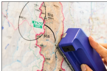
<ホワイトボード用ラミネート>