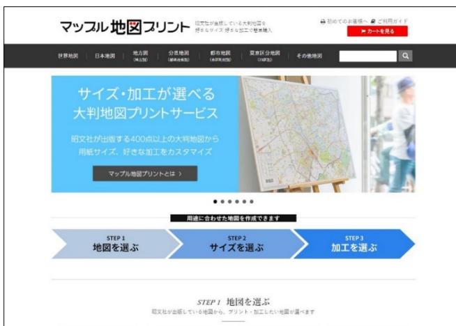
&lt;サービスサイト TOP 画面&gt;

これまで当社では、「もっと大きなサイズの地図が欲しい」「折り目の無い地図が欲しい」「ラミネート加工された地図が欲しい」など、出版物では対応し切れないご要望については、その都度、見積もりから納品まで多くの作業工程を挟む特別注文品として対応して参りましたが、価格や納期の面で十分にユーザーニーズに応えられない場合もございました。