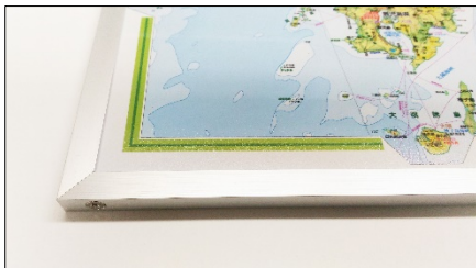
<アルミフレームセット>