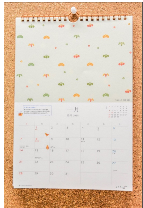
＜『ことりっぷ』カレンダー 左：卓上版 右：壁掛け版＞