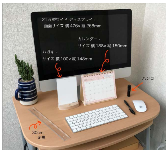
<卓上版 使用例およびサイズイメージ>