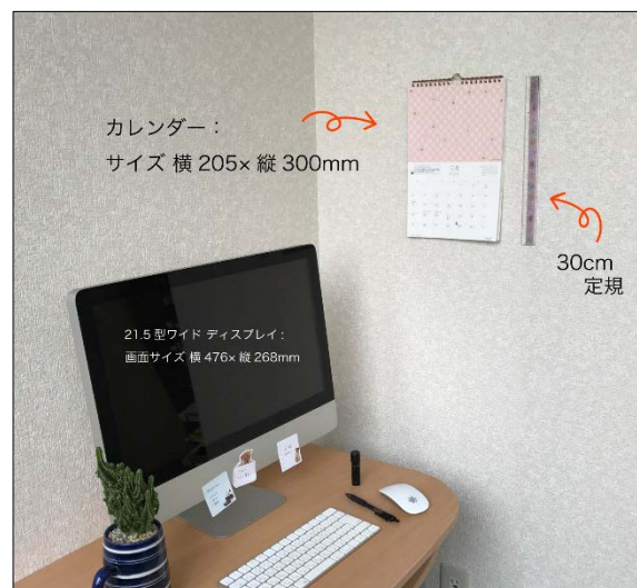
<壁掛け版 使用例およびサイズイメージ>