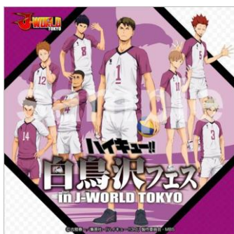
マイクロファイバータオル (全1種/648円)