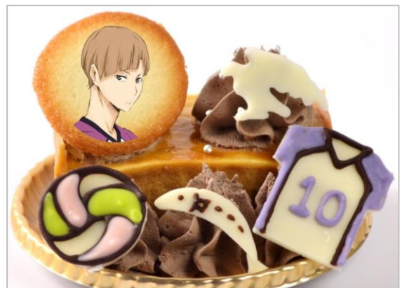
白布賢二郎の“誰よりも目立たないセッターに俺は成る！”ケーキ (キャラメルケーキ) (700円)

白布の髪色をイメージしたキャラメルケーキに、チョコで作った白鷲、ユニフォーム、しらす、パレーボールを添えました。