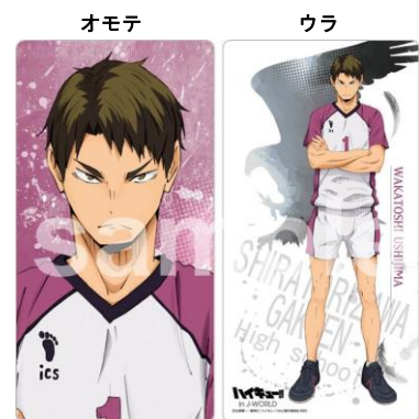
ロングクッション (全1種/2,700円) ※店頭での受注販売