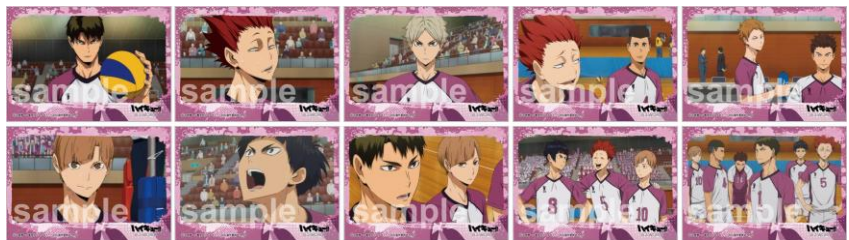
イラストシート (全10種) ※ランダムでお渡し