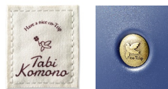
＜左：専用ビスネームと 右：エンブレム＞

併せて「ことりっぷ 旅こもの」専用ビスネームを当社監修の下、コンサイスにてデザインし各商品に貼付することで、売場展開時にことりっぷシリーズとしての統一感を創出します。さらにジッパーキャリーにはことり柄のオリジナル専用エンブレムが付きましますので、さりげないワンポイントとしてのかわいらしさも演出しています。