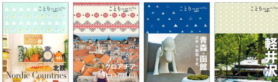
＜商品の柄に採用された「ことりっぷ」の表紙4点＞

第二弾の表紙柄は「北欧」「クロアチア」「青森・函館 八戸・十和田・下北」「軽井沢」の4柄を使用し、 全18種類 を展開。選ぶ楽しさもポイントの一つです。