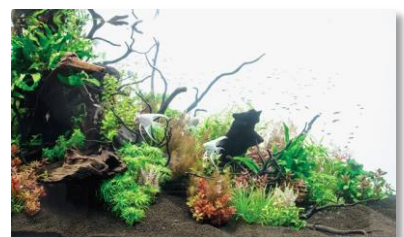
【熱帯魚や金魚の水槽】