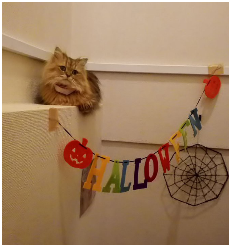
写真 いろいろ (ご自由にお使いください)