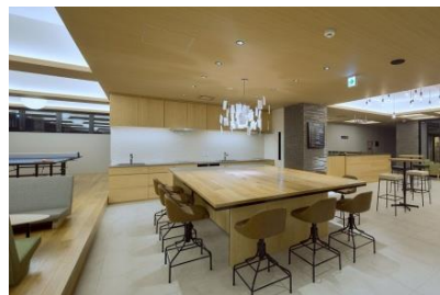
▲オープンキッチン

インテリックスグループでは、築年数の経過した中古マンションを一戸単位で仕入れ、それぞれの物件に最適なリノベーションを施し、アフターサービス保証を付帯した《リノベーションマンション》として、年間1000件以上販売しています。また、リノベーション事業で培ったノウハウをもとに、個人や法人向け内装事業や、不動産小口化商品《アセットシェアリング》など、【つぎの価値を測る】をスローガンに、時代に求められるサービスの提供を行っています。