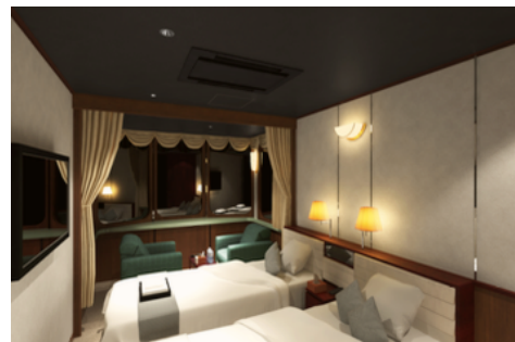
トワイライトエクスプレスを再現した コンセプトルーム

場所：ファーストキャビンステーション あべの荘 大阪府大阪市阿倍野区松崎町 2-2-25