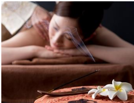
日本製の化粧品のみを使った癒しを体験