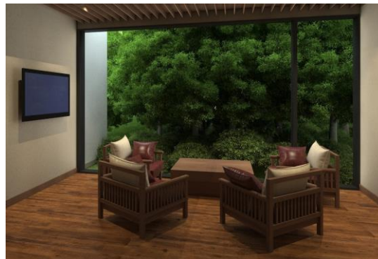
豊かな自然をのぞむスパのロビー