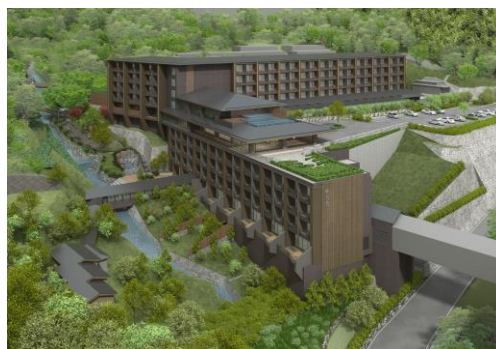
左下の渓谷庭園にある「離れ」がすべてスパになる

「自然と和のおもてなし」をコンセプトにした温泉旅館「箱根小涌園 天悠」は、全室に、箱根ならではの眺望が楽しめる温泉露天風呂がついています。都心からわずか2時間で、春は桜、梅雨はアジサイ、秋は紅葉、冬は雪と、季節ごとに変化する箱根の情景を楽しむことができます。渓谷庭園で行なう朝ヨガや、千条の滝と浅間山をめぐるハイキングなど、箱根の自然を全身で体感できるアクティビティもあり、豊かな箱根時間を過ごしなが五感が癒されるホテルです。「天悠」の風情ある通路で渓谷を渡り、庭園内に静かにたたずむ離れが、『庵 SPA HAKONE』です。