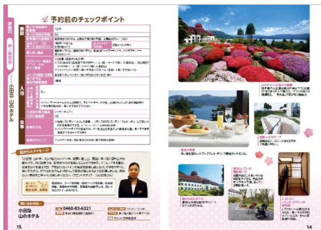
<各温泉宿のバリアとバリアフリー情報 のチェックポイント>

また同行者の方にも喜んでもらえる宿というコンセプトも併せて選定基準に含めています。 各温泉宿のバリアとバリアフリー情報のチェックポイント、現地へ出向く際の公共交通機関のバリアフリー対応表 などもしっかりおさえられているなど、バリアフリー温泉の取材をライフワークとする著者が丁寧な取材を重ねまとめた、高齢化社会へ贈る一冊です。