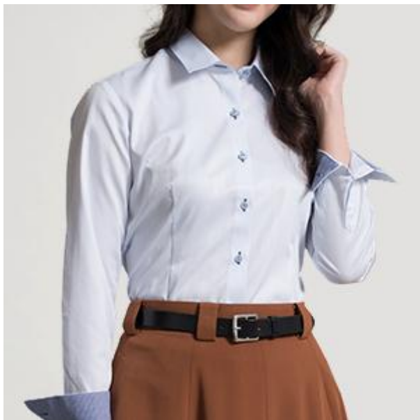
※コーディネートイメージ