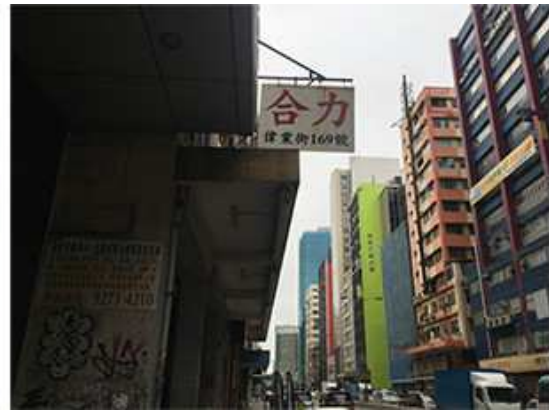
(左)YASHICA LENS - 110° 4K HD Wide Angle を付けて撮影した写真