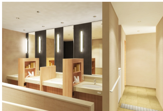
女性パウダールームには充実アメニティが揃う