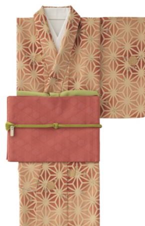
女性ユニフォームイメージ

ファーストキャビンでは今回初めて女性スタッフに和装ユニフォームを採用しました。長寿吉兆の象徴である「亀」をモチーフにした亀甲文様の着物に、抹茶色の小物を利かせたユニフォームと内装デザインにも和のテイストを取り入れるなど、京都ならではの空間づくりでお客様をお出迎えいたします。