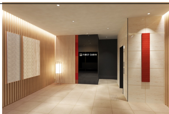
1F エントランスエリア