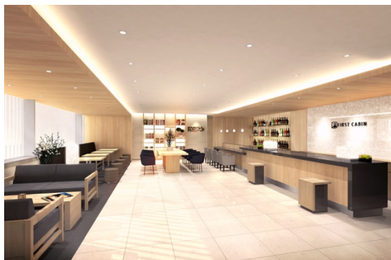
和のテイストを取り入れたフロント・ラウンジ