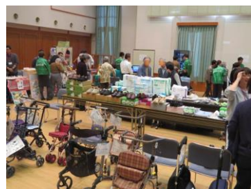
※画像は昨年の様子です