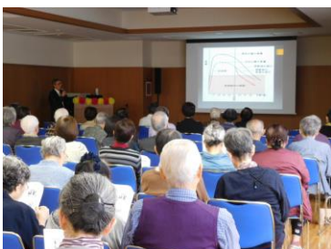
※画像は昨年の様子です

■講演会「高齢者へのエンド・オブ・ライフ・ケアを取り巻く背景と看護職の役割」 13:00～13:40