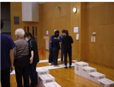
※画像は昨年の様子です