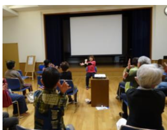
※画像は昨年の様子です