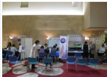
※画像は昨年の様子です

「足型測定・靴の販売・相談」「機能性・便利グッズのご紹介」「聴こえ相談」「頭皮・髪の相談」「お肌に関する相談」「お食事なんでも相談」「よろず承り所（入居者介護互助会）」「お薬の相談・血液サラサラ度測定」「かな拾いテスト（注意機能評価）」