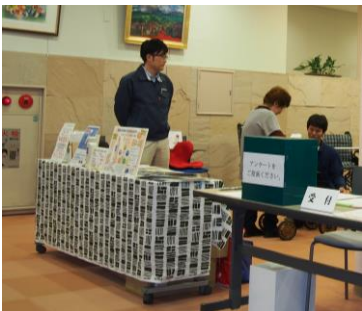
※画像は昨年の様子です