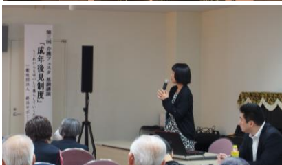
※画像は昨年の様子です