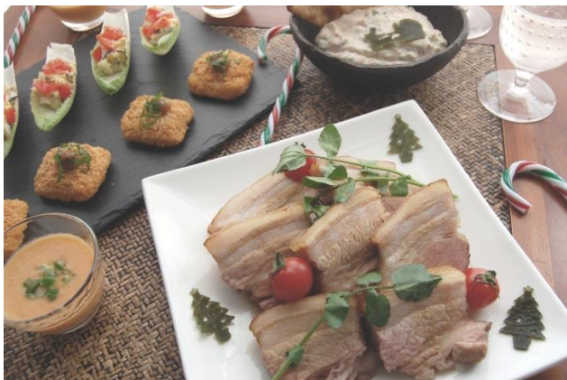
クリスマスパーティのお料理アレンジの例