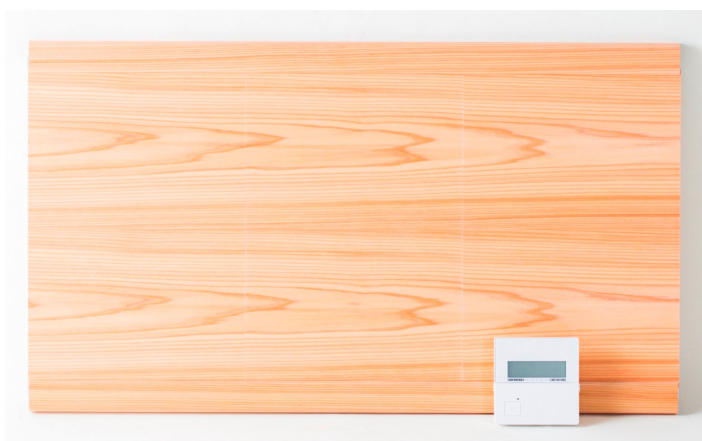
暖カウンター THE WOOD