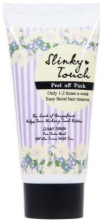
「スリンキータッチ 産毛ピールオフパック」

・スリンキータッチ 産毛ピールオフパックECサイト： http://nonplex.jp/item/1576