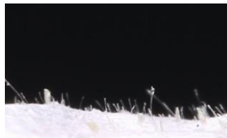
使用後無数の産毛が取れた様子