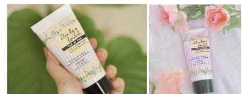
実際にSNSで投稿されている画像

特に10代～20代の女性はサロンよりも手軽で低価格な商品を探求しているのではないかと考え、「スリンキータッチ」シリーズは若い女性をターゲットに絞っています。産毛ケア類似品の中でも、低価格帯で、置いていても“かわいい”インスタ映えになるパッケージを採用。「スリンキータッチ」シリーズのターゲット層は、SNSを活発に使用する世代であるため、一気に拡散されました。