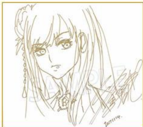
②『キム・ヒョンテ直筆サイン入り アートブック(非売品)』 50 名様