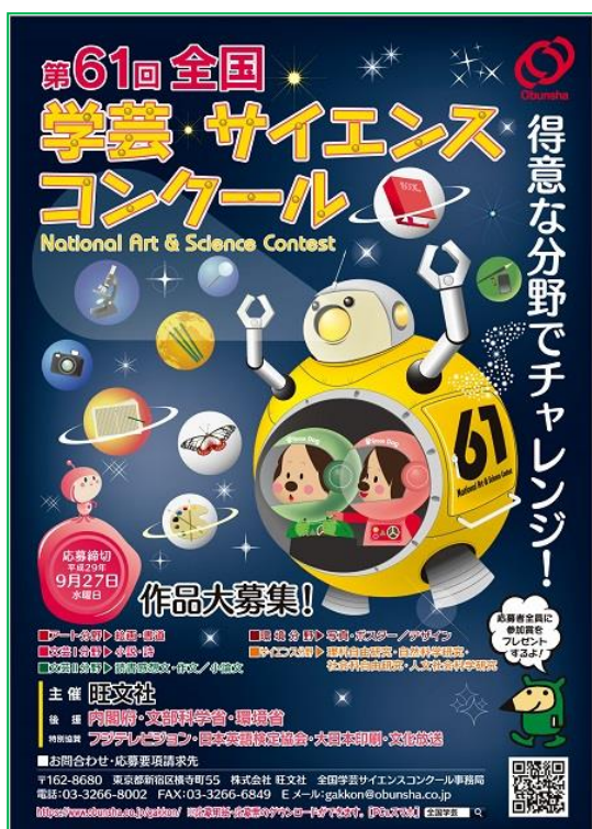
第 61 回 ポスター

部 門 : サイエンス分野 (理科自由研究、自然科学研究、社会科自由研究、人文社会科学研究) アート分野 (絵画、書道) 文芸Ⅰ分野 (小説、詩) 文芸Ⅱ分野 (読書感想文、作文／小論文) 環境分野 (写真、ポスター／デザイン)