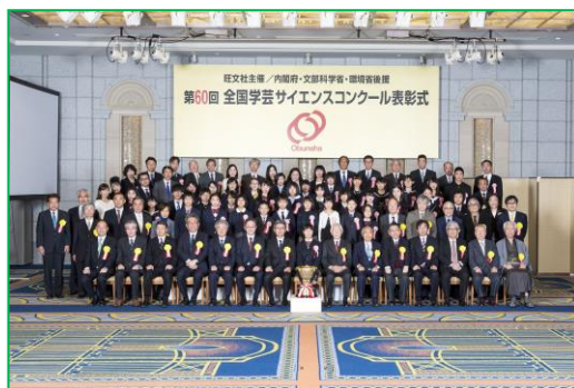
第 60 回 表彰式