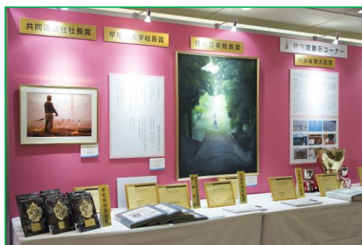
第 60 回 特別賞展示 (表彰式会場)