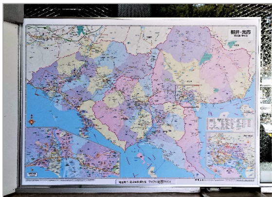
＜島田駅に寄贈の都市地図（A0 判）＞

9月末に山口県光市の JR 山陽本線島田（しまた）駅開業 120 周年記念イベント、11 月上旬に東京都多摩市のパレテノン多摩にて開催の「地図展 2017」にそれぞれパネル地図を寄贈、展示されました。