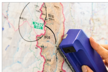
＜ホワイトボード用ラミネート＞