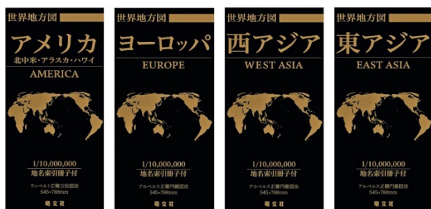
&lt;追加対象地図 世界地方図 4 点&gt;

株式会社昭文社（本社：千代田区麹町、代表取締役社長 黒田茂夫、東証コード：9475）は、8 月に開始しました当社初のオンデマンド印刷サービス「マップル地図プリント」をこのたび拡充し、11 月下旬より「世界地方図」シリーズの『総図 世界地方図 アメリカ 北中米・アラスカ・ハワイ』『ヨーロッパ』『西アジア』『東アジア』および「地方図」シリーズの裏面白図『北海道全図』『東北全図』『関東全図』『中部全図』『近畿全図』『中国全図』『四国全図』『九州 沖縄全図』を追加販売することをお知らせいたします。