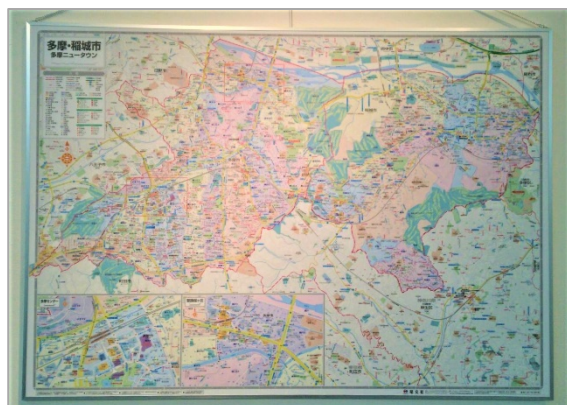
＜多摩市に寄贈の都市地図（B0 判）＞