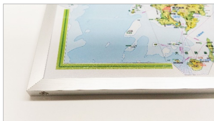
＜アルミフレームセット＞