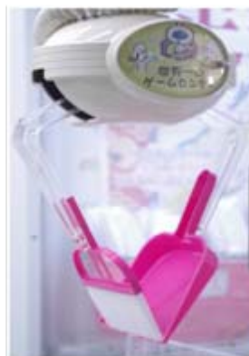
↑アーム部分にほうきとちりとりにつけて景品をゲットする

ほうきで掃ける軽さ がありながらも、水だけで汚れを落とすエコなメラミンスポンジなど 機能性の高いお掃除グッズ を選びました。使っていて掃除が楽しくなるような かわいらしいデザイン もこだわりのひとつです。