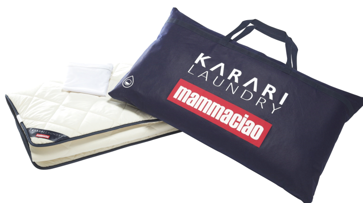
カラリランドリー mammaciao 敷ふとん