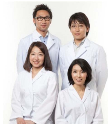
商品開発・販売に関わる スタッフ全員が 毛髪診断士 を取得

使用方法：濡れた手に適量を取り、髪が乾いた状態で白髪が気になる部分になじませて20～30分放置した後、よくすすいでシャンプーし、トリートメントで整えてください。色がなじんでからは、シャンプー後のトリートメントとしてご使用可能です。