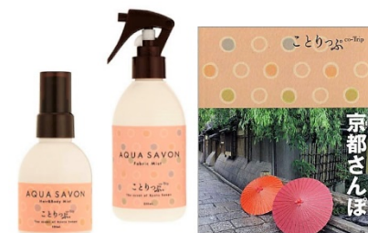
<京都さんぽの香り>

盆地によって寒い冬を過ごす京都に、ようやく訪れる春、そして夏へと移り変わる季節を織り込み、桜、お茶の印象を残した香り。