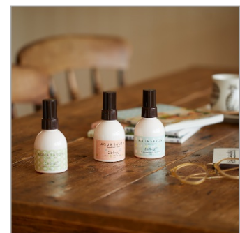
<ヘアー&ボディミスト>