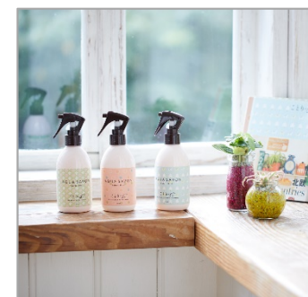
<ファブリックミスト>