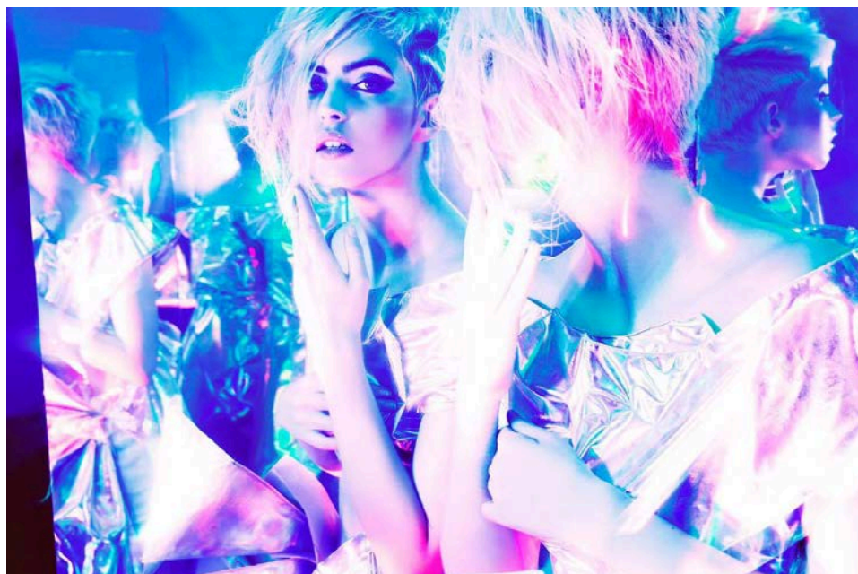
－ バンタン卒業修了制作展『VANTAN STUDENT FINAL 2018』キービジュアル －

東京校は2017年2月24日(土)にベルファール渋谷にて、大阪校は2017年2月23日(金)に大阪市中央公会堂にて開催いたします。