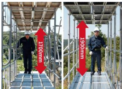
安全性と作業効率向上に、20 cm の差は大きい

『Iq SYSTEM』は、当社が開発し 2012 年より販売・レンタルしている、安全で作業しやすいシステム足場です。『Iq SYSTEM』は、安全・機能・効率・経済というすべての面で、建設会社や施工会社などから高い評価と支持を得ており、販売売上は前年比 186%アップと普及が加速しています。2017 年 7 月には販売社数が 200 社を超え、9 月には累計普及平米数がマンション約 1,000 棟分に相当する 4,000,000 m 2 を超えました。