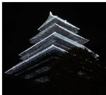
試験点灯の様子（12 月 11 日）