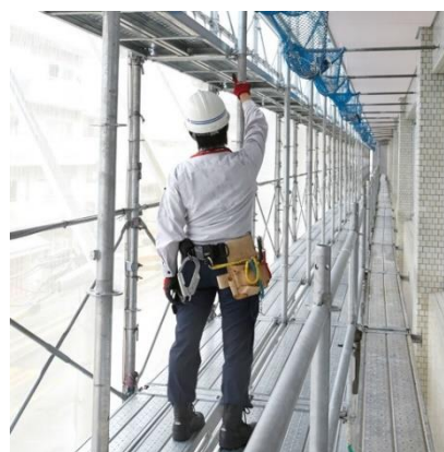
普通の廊下にいるような感覚で作業できる

『Iq SYSTEM』開発の背景には、こうした建設業界の常識に疑問を抱いた当社代表の「安全で作業効率もよい足場を提供したい」という想いがありました。『Iq SYSTEM』最大の特長は、従来よりも 20 cm 高い 190 cm の階高と、隙間や段差のない床面で、普通の廊下にいるかのような広々とした空間で安全に作業できることです。また、『Iq SYSTEM』は、保管・運搬・設置面での効率化も図っており、保管面積約 60% 弱減（※2）・運搬車両台数約 30% 減（※3）、約 15% の軽量化（※4）も実現しています。