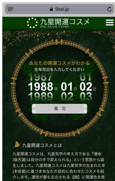
【九星開運コスメ】 https://9sei.jp トップ