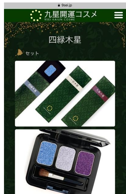
四緑木星の開運コスメ表示