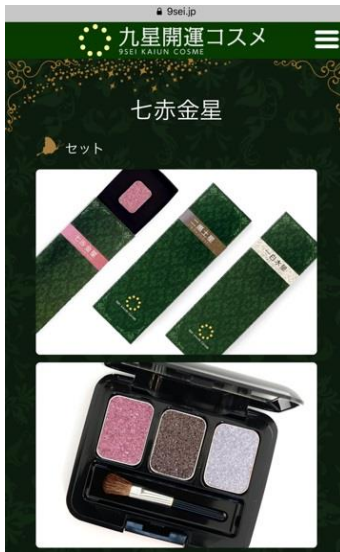
七赤金星の開運コスメ