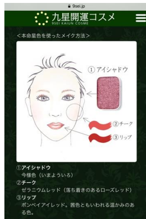
本命星開運メイク