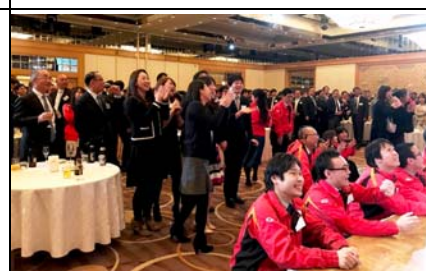
豪華賞品がかかったゲームは大盛り上がり