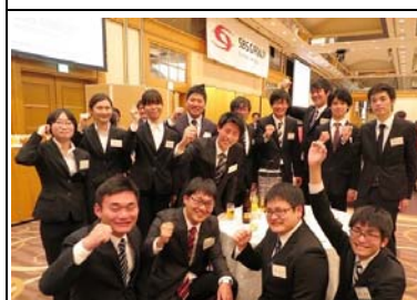
2019 年度 4 月入社新卒内定者たち