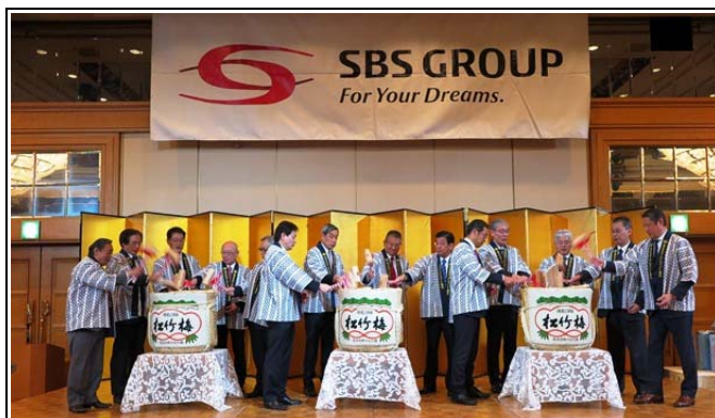
グループ会社の代表が全員集合して鏡割り

SBS グループは、1 月 4 日、東武ホテルレバント東京(東京都墨田区)にて、全国の拠点から 755 名の社員が集まり、2018 年グループ新年会を開催いたしました。