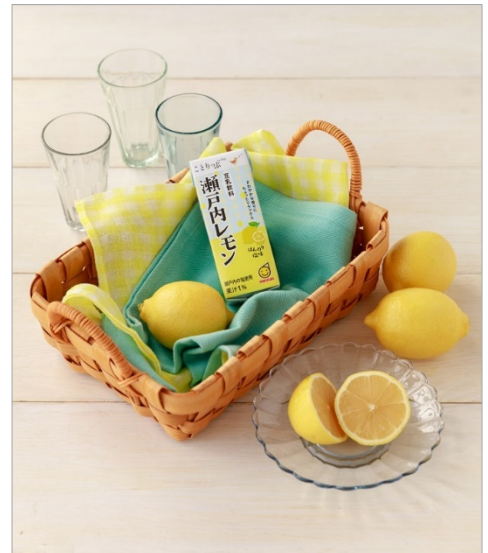
＜ことりっぷ豆乳飲料『瀬戸内レモン』 商品イメージ＞

※2「瀬戸内レモン」の新発売につき、既存商品の「ゆずはちみつ」は終売となり、シリーズとしては「瀬戸内レモン」「黒蜜きなこ」「栗と和三盆」の3種展開となります。