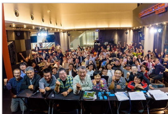
<昨年10月開催のツーリングイベントより>

●詳細はカルカルの公式サイト（⇒ http://tcc.nifty.com/schedule ）、および弊社コーポレートサイト（⇒ http://www.mapple.co.jp/mapple/news/others/ ）等で後日お知らせ※1いたします。