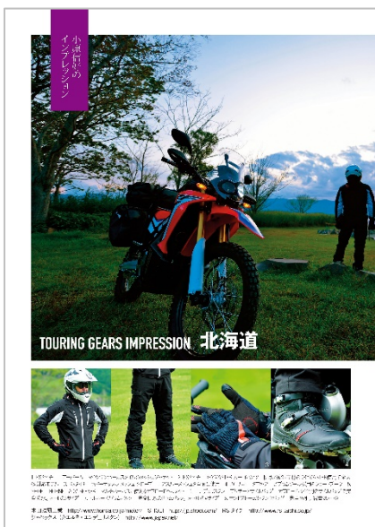
<「全力取材 2018 北海道」>