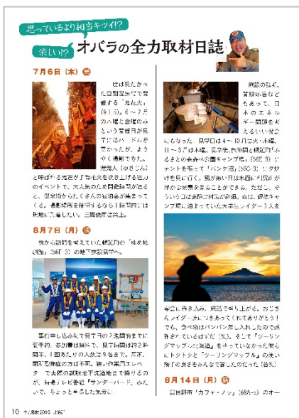
<「全力取材 2018 北海道」>