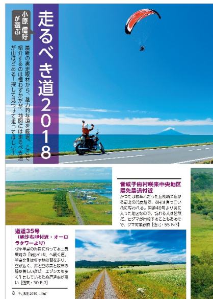
<「全力取材 2018 北海道」>