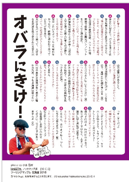
<「全力取材 2018 北海道」>