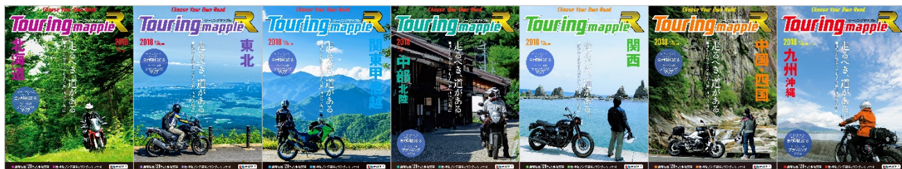
＜上段：「ツーリングマップル」＞