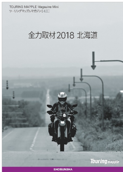
<ツーリングマップルマガジン【ミニ】>