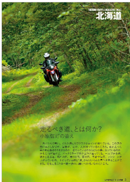
<「全力取材 2018 北海道」>