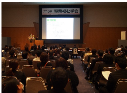
昨年の研究発表の様子