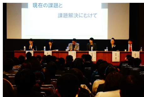
昨年のパネルディスカッションの様子