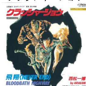
クラッシュジョウ