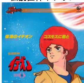
伝説巨神イデオン