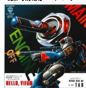
銀河漂流バイファム