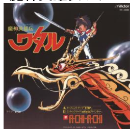
魔神英雄伝ワタル