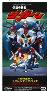
伝説の勇者ダ・ガーン