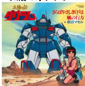
太陽の牙ダグラム