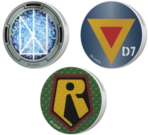
マグネットクリップ（全3種） 伝説巨神イデオン/太陽の牙ダグラム/装甲騎兵ボトムズ 価格：各 500 円