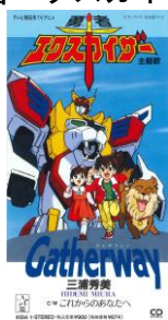
勇者エクスカイザー