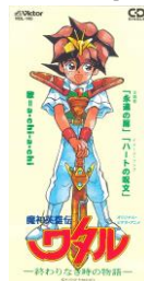
魔神英雄伝ワタル 終わりのなき時の物語