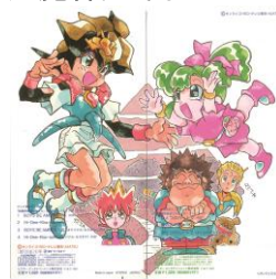
超魔神英雄伝ワタル