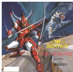
鎧伝 サムライトルーパー