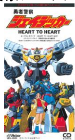
勇者警察ジェイデッカー