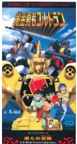
黄金勇者ゴルドラン