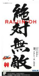
絶対無敵 ライジンオー