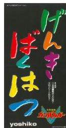
元気爆発 ガンバルガー