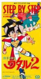
魔神英雄伝 ワタル2