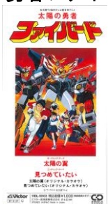
太陽の勇者ファイバード