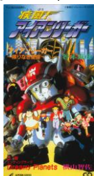
疾風！ アイアンリーガー