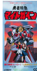
勇者特急マイトガイン