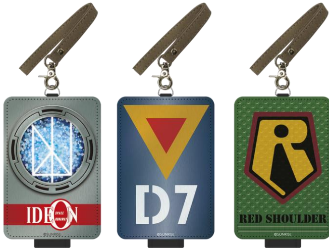
ICカードケース（全3種） 伝説巨神イデオン/太陽の牙ダグラム/装甲騎兵ボトムズ 価格：各 1,900 円