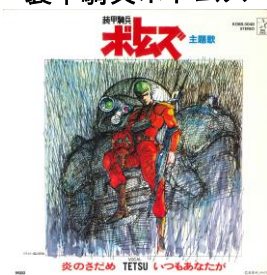
装甲騎兵ボトムズ