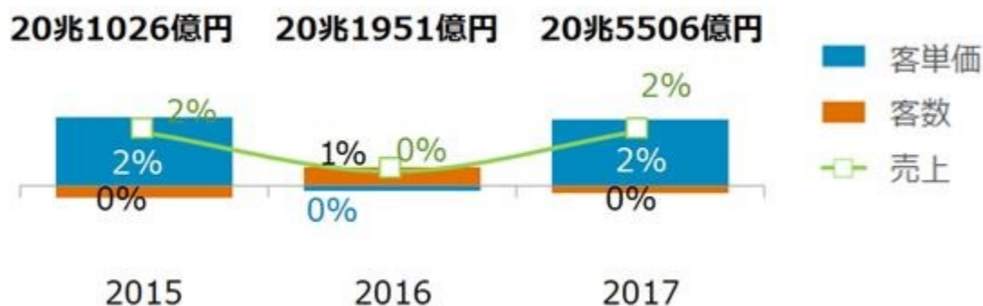
<図表1> 外食・中食市場 成長率

外食・中食市場全体の 2017 年計の成長率（図表 1）をみると、売上（市場規模）は、20 兆 5506 億円で対前年比 2%増、2 期連続（調査開始は 2014 年）のプラス成長となりました。この市場規模の成長は、客単価上昇（+2%）によるものです。客数（食機会数 *2 ）はゼロ成長で、2016 年の 1%増からは一転しました。