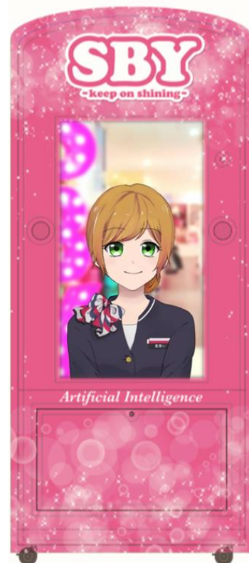
AIスタッフイメージ

人工知能スタッフ「ゆう」がSBYの案内やお問い合わせ対応はもちろん、渋谷のことは何でも(現在勉強中)お答えします！