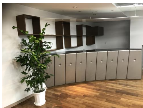
地下ワンフロアを丸ごとリフレッシュルームに

WEB 事業や人材事業、海外医療事業を行う株式会社 DYM（読み：ディーワイエム、本社：東京都品川区、代表取締役社長：水谷佑毅）は、2018 年 2 月 13 日にオフィスを増床し、社員が自由に使えるリフレッシュルームを新設しました。当社は、指定医療機関で無料受診できる制度や、産業医による健康相談会を毎月設けるなど、社員が健康で働きやすい環境づくりを実践しています。