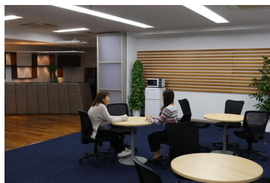
ランチやアイデア出しなど自由に使える