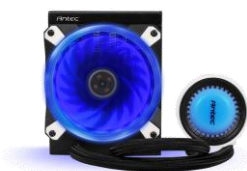
Mercury v2 120

Mercury v2 は、最新の AMD Ryzen AM4 に対応した水冷一体型ユニットの CPU クーラーです。バックプレート設計の変更、あらかじめ塗布されたサーマルグリス、スリーブ加工を施したチューブにより、さらに設置が容易になったマイナーチェンジモデルです。最大 1800RPM PWM に対応した 120mm ブルーLED ファンと、3 つのカラーで温度を知らせるリアクティブ LED 機能を搭載、流量 3.5L/min を誇る大容量ポンプと、0.28mm の極細フィラメントを採用したラジエータにより CPU の熱を素早く輸送して冷却します。高耐久グラファイトベアリングとセラミックシャフト、信頼性を高めた高品質 PTFE チューブによりメンテナンスフリーで、長期 5 年の製品保証を実現、ラジエータサイズが 120mm、240mm、360mm の 3 モデルをラインアップ。