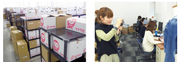
物流センター『ベクトルグローバルポート』