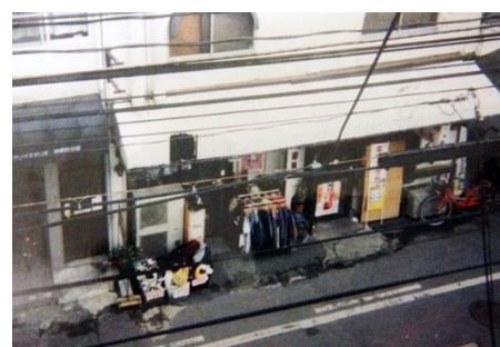
岡山市内の居酒屋軒先で開業(1997 年)

手元のスニーカーが 2,000 足を超えた 19 歳の頃、知り合いの好意で貸してもらった居酒屋の軒先二畳半のスペースでリサイクルショップをスタート。看板も店名もなく、フリーマーケットのように手持ちのコレクションを売買い“わらしべ長者”のようにどんどん品数を増やしていきました。