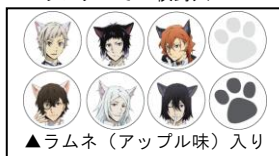
▲ラムネ(アップル味)入り