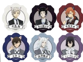
▲ステッカー(全6種) ランダムで1枚封入