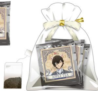
白服3人組のデッドアップルティー(全1種) ※3袋入り 価格: 650 円