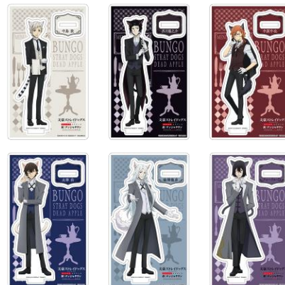
アクリルスタンド(全6種) 価格: 1,200 円