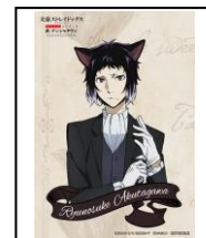
芥川龍之介謹製、 林檎型ブラック・ムースタルト 価格：980 円