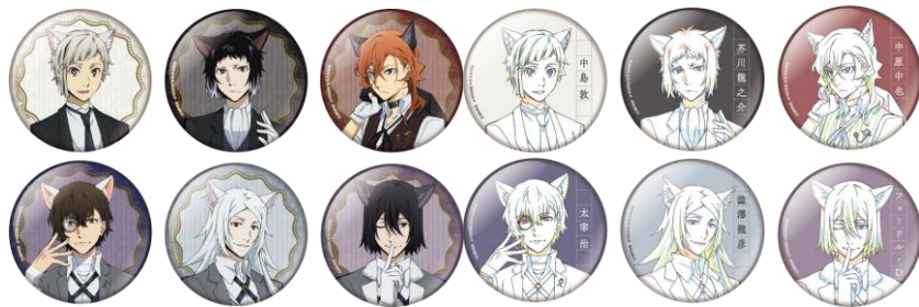
缶バッジコレクション(全12種)※ブラインド仕様 価格: 378 円