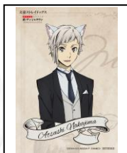
中島敦謹製、 林檎型サンドイッチプレート 価格：900 円