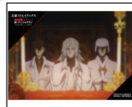
死の果実“DEAD APPLE”ゼリー (レモン&ストロベリー味) 価格：780 円