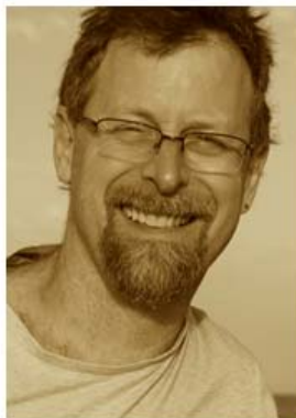
マイケル・ドレリング監督