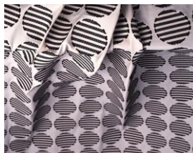
《このぼり》(部分) 《Striped Rounds》2004年

本展のインスタレーションでは、須藤玲子がデザインした約80匹ものこのぼりが、展示室の空間をダイナミックに泳ぎ回る、驚きの幻想空間に入り込んでいただきます。須藤は、子どもの健やかな成長を祈る日本の伝統行事に着想を得て、フランスの展示デザイナーのアドリアン・ガルデルとコラボレーションし、米国ワシントンD.C.のジョン・F・ケネディ舞台芸術センター(2008年)、またパリのギメ東洋美術館(2014年)、六本木の国立新美術館(2018年)にて、この作品を発表してきました。きらめく色とりどりのこのぼりが、OPAMバージョンとしてやってきます。ぜひ五感を刺激するダイナミックなインスタレーションを体感してください。