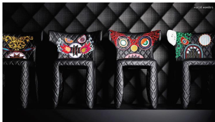
マルセル・ワンダース 《モンスター・チェア》 2014年 Courtesy of Marcel Wanders (以下同)