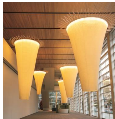
《ユーラシアの庭「水分峠の水草」》 2015年

2015年の春、大分県立美術館(OPAM)の新設開館にあわせて、《ユーラシアの庭「水分峠の水草」》を制作。湯布院と玖珠の境となる水分峠(みずわけとうげ)は、西の筑後川と東の大分川の分水嶺であり、峰々から集まる水が豊かな河川の流れをつくってきました。この水分峠の清水に浮かぶ水草をイメージしたテキスタイルによるシャンデリアが、坂茂のOPAM建築の目玉でもある巨大アトリウムの空間にほんのりと輝き、来館者をやさしく包み込みます。そこには須藤が思いを馳せる原始の自然への、またユーラシアの森羅万象に対する畏怖と恋慕が表されています。