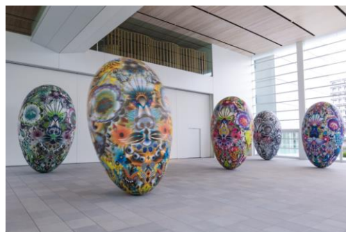
《ユーラシアン・ガーデン・スピリット》 2015年

大分県立美術館では2015年春の開館にあわせて、1階アトリウムで来館者を迎える卵型のバルーン《ユーラシアン・ガーデン・スピリット》を制作。大人も子どもも、訪れる人々が、触ったり、記念撮影をしたり、色とりどりの花々や虫たちを見つめたり、思い思いに楽しみ、親しまれ続けています。オランダ商船が大分の白杵に漂着した後に発展したという日蘭交流の歴史にオマージュを捧げ、ヨーロッパからアジアにわたるユーラシアの姿を、出会いのアートとして作品化しました。華やかな柄は全体では骸骨のように見え、中世ヨーロッパの静物画に描かれる骸骨が意味する「ヴァニタス」(死すべき運命)を表しています。