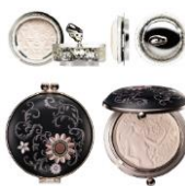
《コーセーコスメデコルテ フェイスパウダー》

マルセル・ワンダースはアムステルダムを拠点に活動するプロダクト&インテリアデザイナー、アートディレクター。アレッシ、パカラ、クリストフル、コーセー、KLMなど数々の企業とのコラボレーション、ハイアットやアンダーズなどホテルや商業施設の内装など、1900を越える数の仕事を展開し、先鋭的なデザインを発信し続けています。