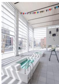
《水府ー覆水難収・フクスイオサメガタシ》 2015年

美術家ミヤケマイが、世界は紛争に向かいつつあると警告し平和を願う作品「世界は届けい・セカイハトドケイ」大分の中心で家内安全を叫ぶ「もどる場所があるということ」、水をテーマにしたインタラクティブな体験型の作品「水府ー覆水難収・フクスイオサメガタシ」、大分の伝統的な切り灯籠による現代版依代「おかえりなさい。」など、大分の文化風土をテーマにした大型のインスタレーションを大分県立美術館(OPAM)の1階アトリウムに展開しています。