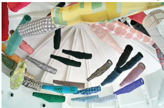
須藤玲子 《こいのぼり》 2014年 フランス国立ギメ東洋美術館