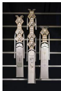
《おかえりなさい。》 2015年