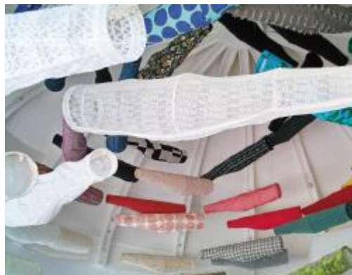
《このぼり》 2014年 フランス国立ギメ東洋美術館