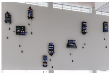
《世界は届けい・セカイハトドケイ大分の中心で家内安全を叫ぶ》 2015年