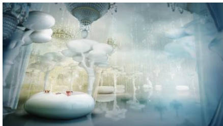
《Virtual Interiors》 2013年～