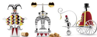
《サーカス》 2016年 Museo Alessi