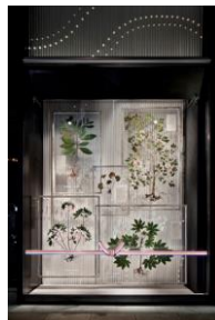
《SHISEIDO THE STORE ウィンドウ》 2018年