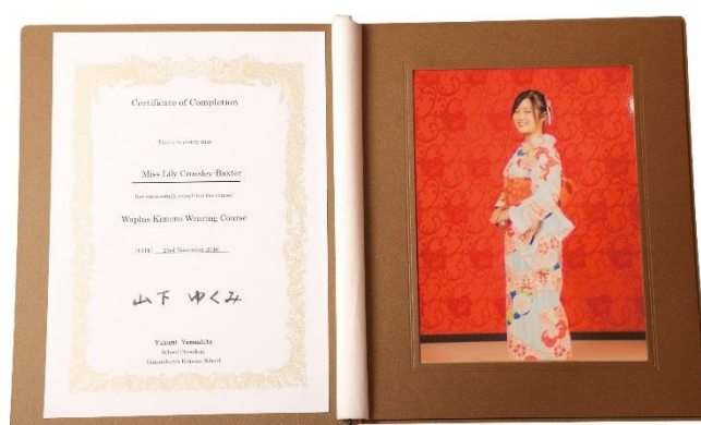
《着付けレッスン修了証》※イメージ